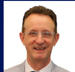
Jörg Holzhäuser Ministerium Rheinland-Pfalz